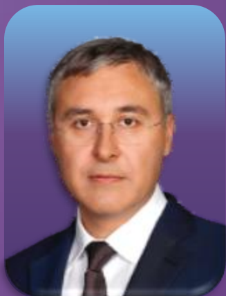
瓦列里·法尔科夫 俄罗斯联邦科学和高等教育 部长