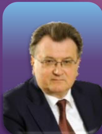
尤里·奥列宁 俄罗斯国家原子能集团公司 科学及战略事务副总经理