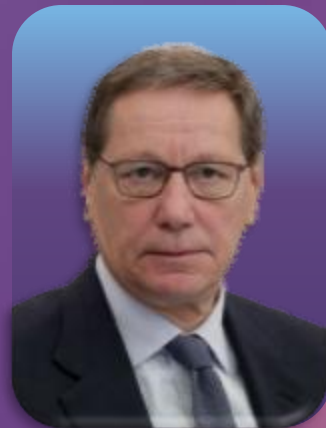
亚历山大·茹科夫 俄罗斯联邦会议国家杜马 第一副主席