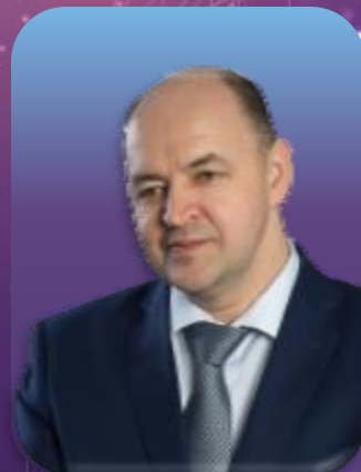
尤里·什莫廷 俄罗斯“联合发动机公司” 总设计师