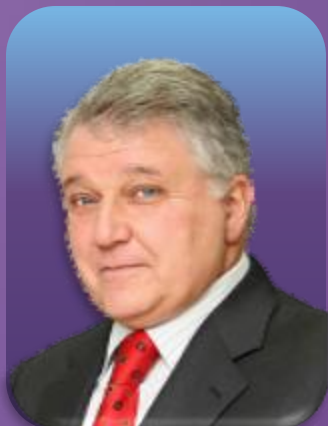
米哈伊尔·科瓦尔丘克 库尔恰托夫研究所所长