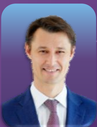
安德烈·西林 俄罗斯“国家技术倡议平台” 执行总监