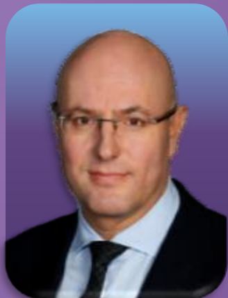
德米特里·切尔内申科 俄罗斯旅游、体育、文化和 通讯事务副总理