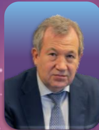
根纳季·克拉斯尼科夫 俄罗斯科学院院长