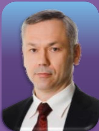
安德烈·特拉夫尼科夫 新西伯利亚州州长