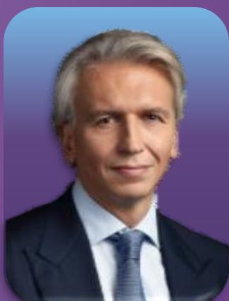
亚历山大·久科夫 俄罗斯天然气工业股份公司 管理委员会主席